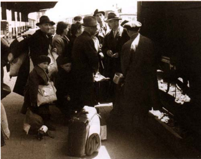
Déportation des Juifs de Hanau, Allemagne, vers Theresienstadt, 30 mai 1942.

Le train a joué un rôle crucial dans l'application de la solution finale. L'organisation et la coordination des transports étaient un sujet compliqué, en particulier dans les conditions de la période de la guerre. Du fait de l'accroissement des manques en matière d'approvisionnement et de la priorité donnée aux transports militaires, l'attribution de trains pour la déportation des juifs n'était pas toujours une chose facile à accomplir. Cela demandait une collaboration étroite de toutes les administrations, la S.S., les responsables civils des chemins de fer allemands, le ministère des transports, et même, parfois, le ministère des affaires étrangères, pour pouvoir ainsi surmonter les difficultés et permettre aux transports de fonctionner si efficacement que des centaines de milliers de Juifs purent être déportés vers leur mort.