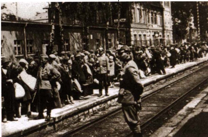
Juifs rassemblés dans la gare pour être déportés, Olkusz, Pologne, juin 1942

Nous sommes alors arrivés dans la cour de l'abattoir [le point de rassemblement] et nous y sommes demeurés une nuit entière. Tout était trempé. C'était une terrible nuit. C'était le commencement. Ce fut la première fois que j'ai été battu. C'était un officier S.S. de haut rang qui se tenait à l'entrée. Il y avait des escaliers raides qui menaient en bas dans la cour et les gens n'allaient pas assez vite. C'est pourquoi il m'a poussé et a hurlé: "qu'est-ce que vous attendez? Le prochain tram? Il n'y aura plus jamais de tram pour vous!"... Peu de temps après, nous avons du nous déshabiller totalement et nos affaires ont été prises.