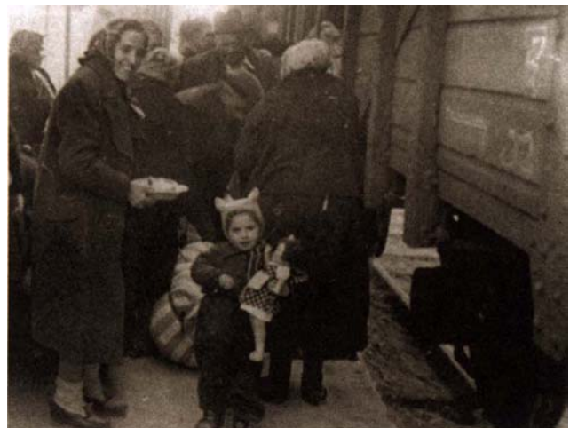
La déportation des juifs de Thrace, Macédoine, vers Treblinka

Le lendemain à l'aube nous avons été conduits de force au quai. Le train n'était pas arrivé. Il faisait un froid de canard. Nous sommes restés là debout encore et encore de 04:00 à 9:00. On nous a alors appelés et le voyage a commencé ce 11 décembre 1941 ... Tout nous avait été pris. Une des personnes a questionné un des gardes, un S.S., pour savoir quand le train viendrait? Ils ont pris un gourdin et l'ont tellement frappé qu'il est resté là sur le sol. Il n'a pas fait partie du convoi. C'était notre premier mort. C'était le commencement.