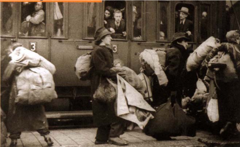
La déportation des juifs de Bielefeld, Allemagne, 13 décembre 1941