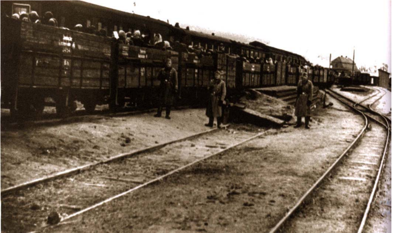
La déportation des juifs de Lodz, Pologne, vers Auschwitz.