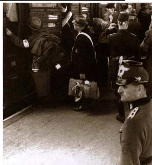
La déportation des juifs de Hanau, Allemagne, vers Theresienstadt, 30 mai 1942