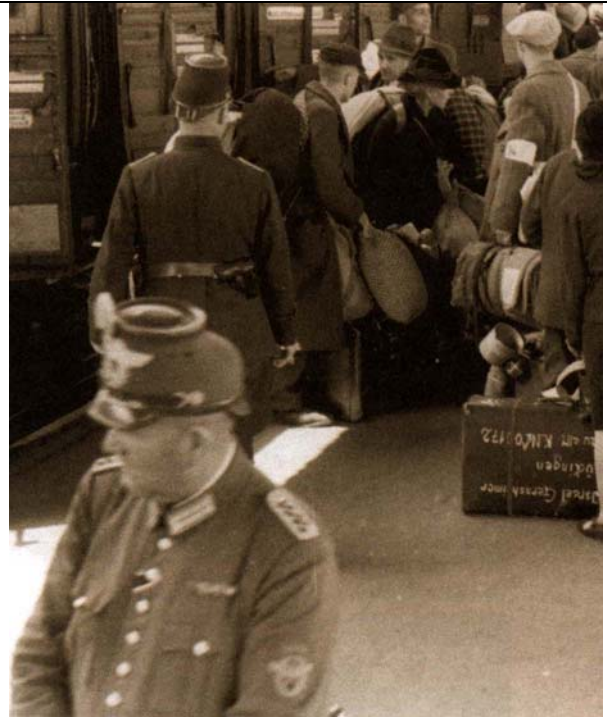
La déportation des juifs de Hanau, Allemagne, vers Theresienstadt, 30 mai 1942.

* Le livre « How was it humanly possible ? » accompagné de la brochure pédagogique est disponible en anglais. Pour le commander contacter nous par email : education.sales@yadvashem.org.il