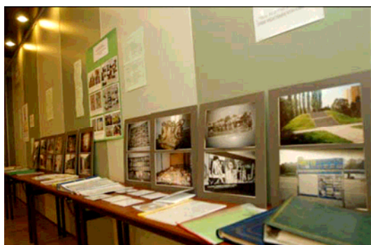
Moksleivių darbų paroda konferencijoje "Gyva Lietuvos žydų istorija". 2004 metų rugsėjo 23 – Holokausto aukų Atminimo diena Lietuvoje.

Svarbu atkreipti dėmesį į projektus, susijusius su krašto istorija. Tai padės mokiniams pajusti ryšį su jų gimtinės istorija. Tyrinėdami savo krašto istoriją, mokiniai gali sužinoti, kokią vaidmenį prieškarinės Europos istorijoje vaidino vietinės žydų bendruomenės. Taip pat jie gali sužinoti, kaip palaipsniui buvo apribojamos vietinių žydų teisės, kol galų gale jie buvo deportuoti ir išžudyti mirties stovyklose. Viena Varšuvos mokyklų organizavo didelį projektą, skirtą Holokausto aukoms atminti. Darbas tęsėsi visus metus, o jo kulminacija tapo Holokausto aukų Atminimo dienos pravedimas balandžio 19 dieną – Varšuvos geto sukilimo pradžios metinių dieną. Mokiniai parengė parodą apie Varšuvos getą. Jie atrinko medžiagą ir suformavo standus apie atmintinas vietas, kurios yra netoli jų mokyklų (pvz., Varšuvos geto paminklas ir Umschlagplatz – žydų deportavimo į mirties stovyklas vieta). Jie taip pat parengė standą, skirtą visoms kadaise buvusioms mieste sinagogoms.