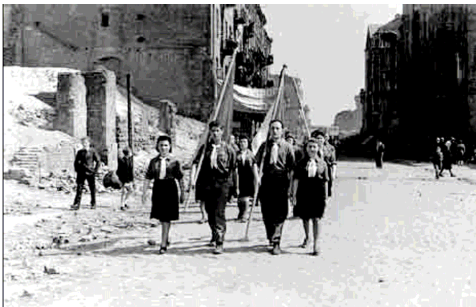
Lenkija, Varšuva, po karo. Memorialinis maršas, skirtas Holokausto aukų atminimui. (Jad Vashem)

Kai kuriose šalyse Holokausto aukų atminimo diena egzistuoja jau seniai, kitose – tai nauja tradicija. Minėdamos šią dieną, valstybės organizuoja oficialias ceremonijas ir specialius parlamento posėdžius. Šie renginiai plačiai nušviečiami vietinėje, valstybinėje bei tarptautinėje spaudoje.