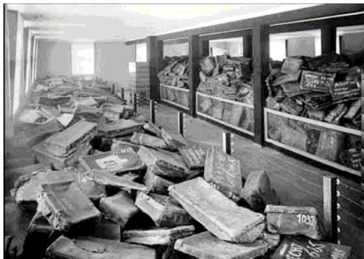
Osvencimas, Lenkija, po karo. Lagaminai muziejuje, Jad Vashem.

Norvegijos pradinio ir pagrindinio išsilavinimo Departamentas skatina visas mokyklas organizuoti renginius, skirtus Holokausto aukoms atminti. Mokykloms pateikiama visa reikalinga medžiaga tam skirtame specialiaame interneto puslapyje. Daugelis mokyklų organizuoja poezijos vakarus, parodas, skirtas Holokaustui. Kitos mokyklos rengia memorialines eisenas su deglais. Jie kviečia į eisenas Holokausto liudininkus, tuos, kas išgyveno, prašydami juos papasakoti apie savo asmeninius išgyvenimus.