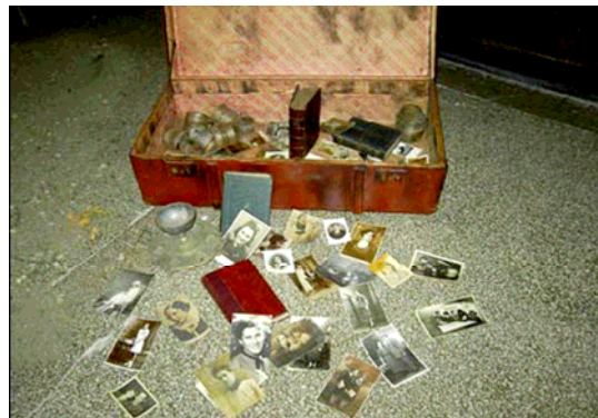
Šis lagaminas pademonstruotas parodoje, skirtoje Holokausto Aukoms atminti. Jį sukūrė Rumunijos Vlaiku Vode Nacionalinio koledžo Atminties klubo nariai. 2004 m. spalio.