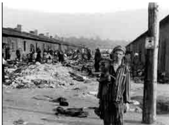
Buvęs koncentracijos stovyklos kalinys prie barakų, Bergen-Belzen, Vokietija

Atminimo dienos proga mokytoja gali organizuoti susitikimą su Holokausto liudininkais (ypač su tais, kam pavyko išgyventi, su koncentracijos stovyklą vadavusiais žmonėmis, aukų gelbėtojais). Liudininkų parodymai padeda mokiniams susidaryti aiškesnį įspūdį. Be to, labai sėkmingai galima panaudoti iš anksto parengtus video įrašus – "istorija per veikėjų paveikslus".