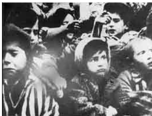
Vaikai iš koncentracijos stovyklos tiesia rankas, pasitikdami išlaisvintojus, Osvencimas, Lenkija