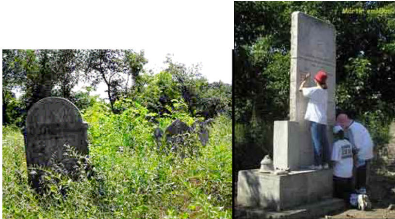
Mok sleiviai tvarko apleistas žydų kapines Zsobe, Vengrija, 2002. (Budapešto "Lauder Javne" žydų mokykla)

Vengrijos sostinės Budapešto "Lauder Javne" mokykla organizuoja vasaros programas mokiniams, kurių metu jie tvarko apleistas žydų kapines. Savaitę moksleiviai tvarko kapines ir atstato nuverstus antkapius. Jie taip pat bando atstatyti ir iššifruoti antkapių užrašus ir stengiasi atkurti kadaise šioje vietovėje egzistavusios žydų bendruomenės istoriją. Programos pabaigoje mokiniai pamini visus tuos, kurie žuvo Holokausto metu, kuomet buvo sunaikinta klestėjusi iki karo žydų bendruomenė. Projekte taip pat dalyvauja kai kurios vietinės mokyklos ir savivaldybės.